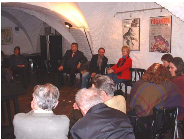
Workshop im Malzhaus zur Antirassismus-Party

Beim Mobilien Beratungsteam Neukirchen konnten sich Interessierte zum Thema „Argumentieren gegen rassistische Parolen - ohne Gewalt“ austauschen und Anregungen holen.