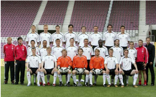
Will den WM-Titel: Deutsche Fußballnationalmannschaft

Die Zeit des Wartens hat ein Ende. Wenn sich heute Abend Deutschland und Costa Rica in München gegenüber stehen, beginnt sie endlich: Die Fußballweltmeisterschaft 2006 in Deutschland. Bis zum 9. Juli 2006 wird dann in insgesamt 64 Partien ermittelt, wer sich für die kommenden vier Jahre mit dem Titel des Fußball-Weltmeisters schmücken darf. Die Favoriten sind schnell genannt: An erster Stelle na-