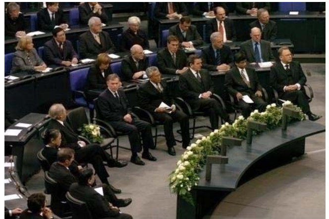
Staatsakt im Deutschen Bundestag zum Gedenken an die Opfer der Flutkatastrophe an den Küsten des Indischen Ozeans