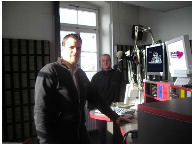
Rolf Schwanitz im Studio von Radio Euroherz in Hof

Ende Januar war Staatsminister Rolf Schwanitz zu Gast bei dem auch im Vogtland beliebten Hofer Rundfunksender "Radio Euroherz". Einen ganzen Vormittag stand er im Studio bei einer Sondersendung zu Hartz IV als Experte Rede und Antwort. Nach fast einem Monat Hartz IV zog Schwanitz eine erste kleine Zwischenbilanz: "Die Umstellung war nicht so schwierig wie erwartet. Insgesamt war der Start in Ordnung. Ein großes Lob auch für die Mitarbeiter der Arbeitsagenturen." Wichtig ist für ihn jetzt, dass der Umbau der Bundesagentur endlich vorankommt. Die Vermittlung von Arbeitslosen - das Kerngeschäft - muss endlich wieder im Mittelpunkt stehen.