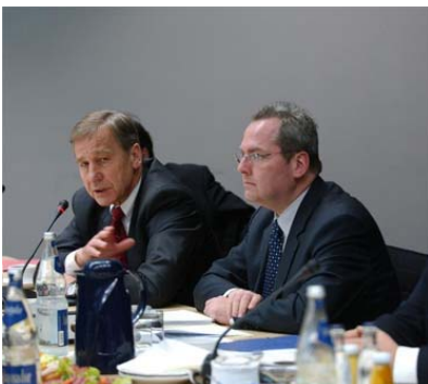
Wolfgang Clement und Rolf Schwanitz im Vermittlungsausschuss

Im Jahr 2004 hat die ostdeutsche Industrie ein Umsatzwachstum von 8,1 Prozent erreicht. Damit lag das Umsatzwachstum erneut deutlich höher als in der westdeutschen Industrie, die ein Umsatzwachstum von 5,1 Prozent erreichte. In Ostdeutschland ist auch die Anzahl der Betriebe um 2,3 Prozent und die der Beschäftigten um 1,1 Prozent gestiegen. Die Exportquote hat sich leicht von 24,5 auf 24,8 Prozent erhöht. Dies zeigt, dass sich die Industrie in den neuen Ländern auf einem stabilen Wachstumskurs befindet, die Unternehmen ihre Chancen und Standortvorteile nutzen und sowohl im In- als auch im Ausland ihre Marktposition weiter verbessert haben. Die ostdeutsche Investitionsförderung durch Bund, Länder und EU, die im wesentlichen auf das verarbeitende Gewerbe konzentriert ist, hat wesentlich zu dieser positiven Entwicklung beigetragen.