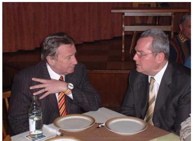
Bernd Hering, Landrat des Landkreises Hof, im Gespräch mit Staatsminister Rolf Schwanitz

Die betroffenen Anwohner werden darüber im April 2005 informiert werden. Damit wird der Lärmschutz an der A 72 endlich deutlich verbessert.