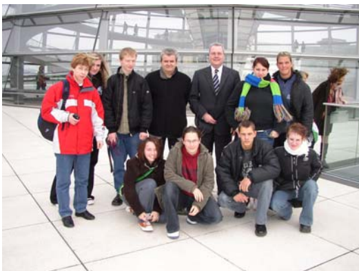
Die Börsenspielgewinner aus dem Vogtland gemeinsam mit Rolf Schwanitz vor der Kuppel des Berliner Reichstags

Platz, erfuhren Geschichtliches zum Haus und konnten das Geschehen verfolgen. Danach wurden die Teilnehmer von Rolf Schwanitz begrüßt.