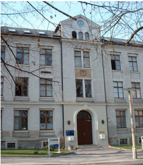
Die Studienakademie in Plauen