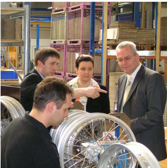
Zu Besuch bei der Behr Industry GmbH & Co. KG

so Schwanitz zu Beginn seiner Gespräche. Natürlich ist gerade jetzt die betriebliche Erstausbildung das Gebot der Stunde. Die Erhöhung der Ausbildungsbereitschaft muss deshalb ein zentraler Punkt in den strategischen Überlegungen der Betriebe und Kammern sein. Insgesamt muss es jedoch auch darum gehen, den Bereich regionale Wirtschaft und Schule enger als bisher miteinander zu verbinden. Bei der Firma Behr Industry GmbH in Reichenbach zum Beispiel ist dies schon heute ein wichtiges Anliegen vorausschauender Personalpolitik. Dieser moderne und erfolgreiche Hersteller vom Motorradteilen, Kälte- und Klimatechnik veranstaltet Betriebsbesichtigungen, Praktika und Elternabende und fördert so langfristig das Interesse von Schülern und Eltern. Grundlage hierfür sind Kooperationsverträge mit Schulen der Region. Solche Formen der Zusammenarbeit zwischen Unternehmen und Schulen sind sinnvoll und sollten in noch größerem Umfang im gesamten Vogtland zur Anwendung kommen.