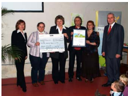
Rolf Schwanitz bei der Auszeichnung der Sieger

Unter der Schirmherrschaft des Parlamentarischen Staatssekretärs im Bundesgesundheitsministerium, Rolf Schwanitz, veranstalteten die Betriebskrankenkassen gemeinsam mit anderen Partnern den Präventions-Wettbewerb "Fit von klein auf" für die Regionen Berlin und Brandenburg. Ziel des Wettbewerbs war es, vorhandene Aktivitäten in Kindereinrichtungen zu sammeln, gute Praxisbeispiele herauszustellen und neue Impulse für einen gesünderen Kindergartenalltag zu geben. Rolf Schwanitz freute sich sehr, die Gewinner, die Kindertagesstätten "Hasenburg" (Berlin) und "Kinderrabatz" (Brandenburg) persönlich auszeichnen zu können.