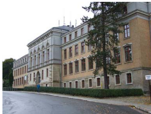
Profitierte vom Ganztagschulprogramm des Bundes: Die Seminarschule in Auerbach

Unterstützt wird das Ganztagschulprogramm des Bundes in Sachsen durch das von der CDU-SPD-Koalition in Dresden aufgelegte Begleitprogramm. Hierbei werden die Investitionen sinnvoll durch finanzielle Hilfen für Honorarkräfte an den Schulen ergänzt. Besonders wichtig: Von den insgesamt hierfür im Freistaat vorgesehenen 30 Millionen Euro sind nach derzeitigen Prognosen (bisher erfolgte Bewilligungen und noch zu bescheidende Anträge) in diesem Jahr erst 16 Millionen Euro abgeflossen. Fast die Hälfte der Fördermittel steht also noch zur Verfügung. "Eine solche Chance sollten sich die Schulen im Vogtland nicht entgehen lassen. Ich fordere alle interessierten Schulen auf, jetzt noch Anträge zu stellen.", so Schwanitz zu der Situation.