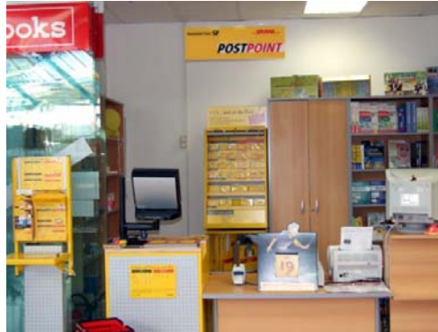
Der neue Postpoint im Plauenpark in Kauschwitz