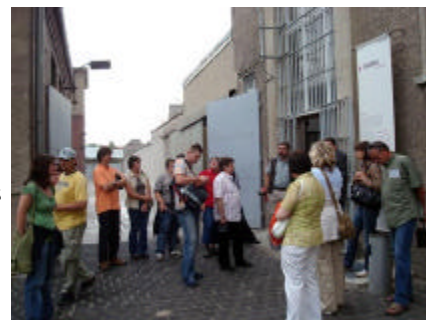
Im Stasigefängnis Hohenschönhausen